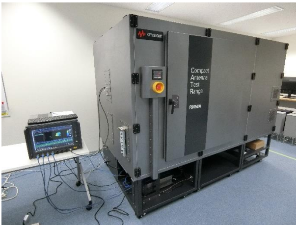
コンパクトアンテナテストレンジ外観